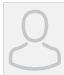
Poste vacant Estrie