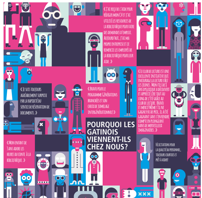
Bibliothèque municipale de Gatineau, 2016