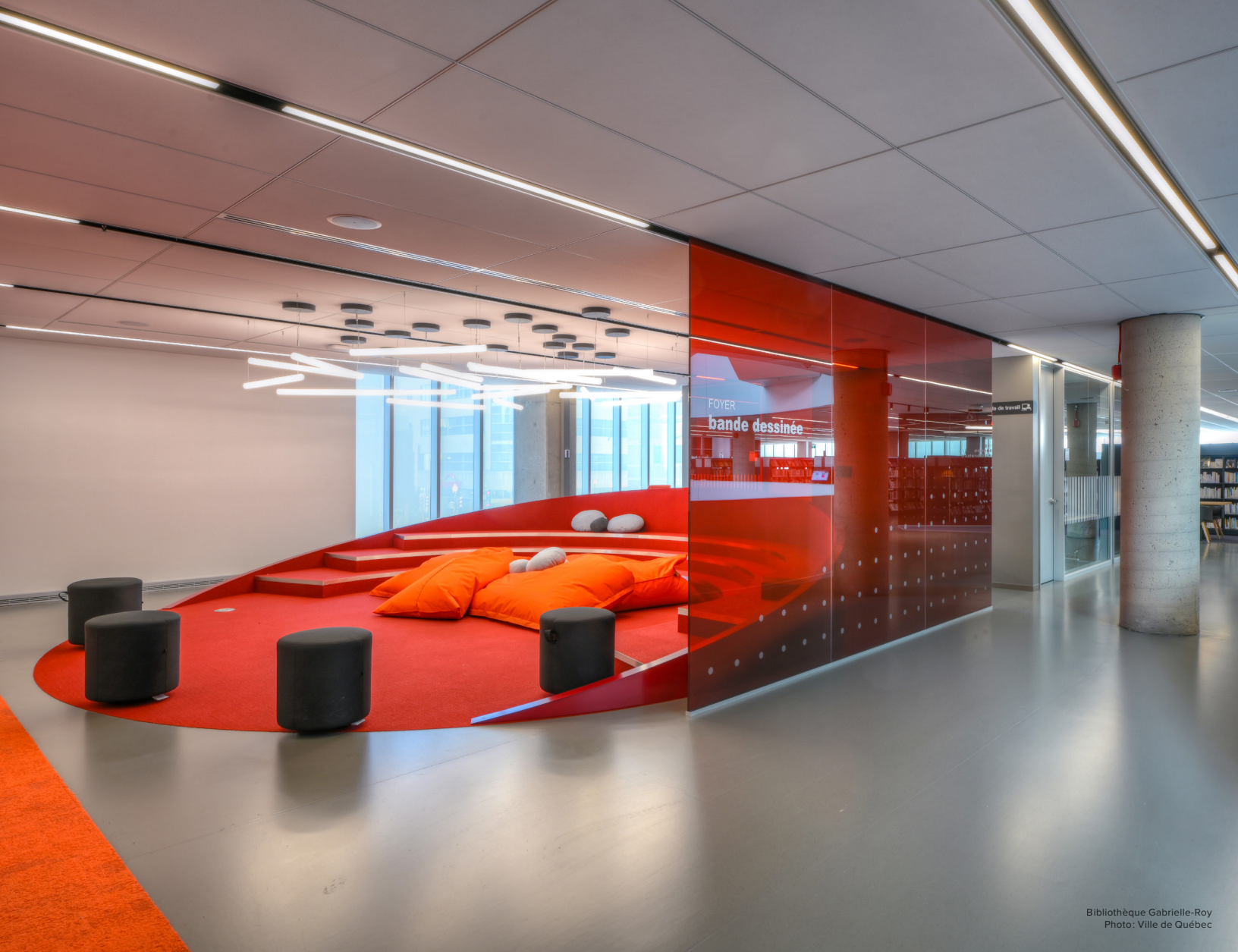
Bibliothèque Gabrielle-Roy

INFORMATION | CULTURE | ÉDUCATION | LITTÉRATIES