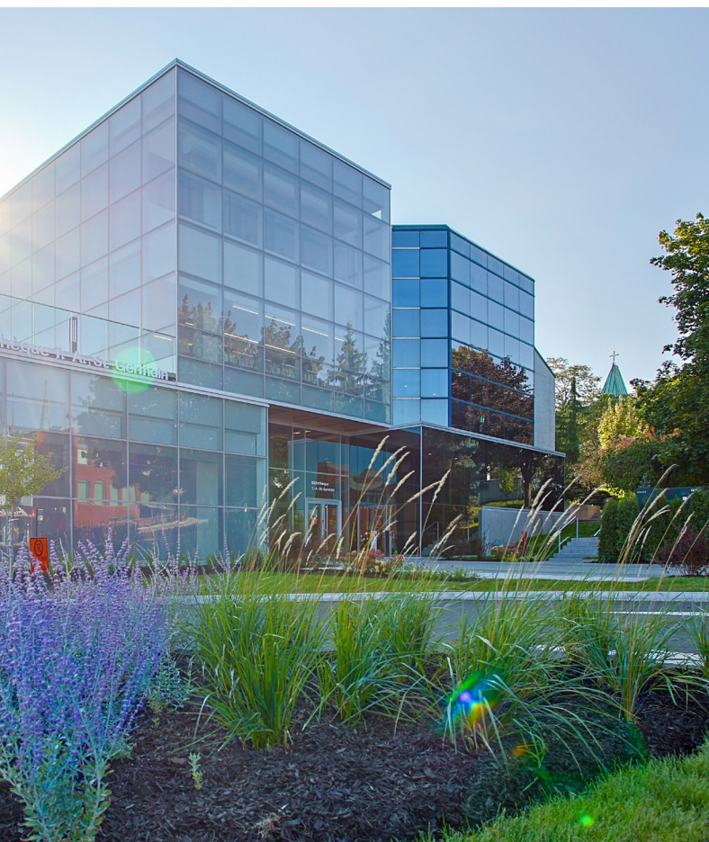
Bibliothèque T.-A.-St-Germain

Plus de 40 ans après le Plan Vaugeois, force est de constater que le chantier n'est toujours pas complété. De nombreuses communautés n'ont toujours pas accès à une bibliothèque publique de qualité dans leur localité.