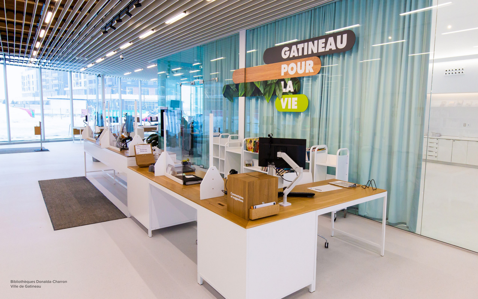
Bibliothèques Donalda-Charron Ville de Gatineau