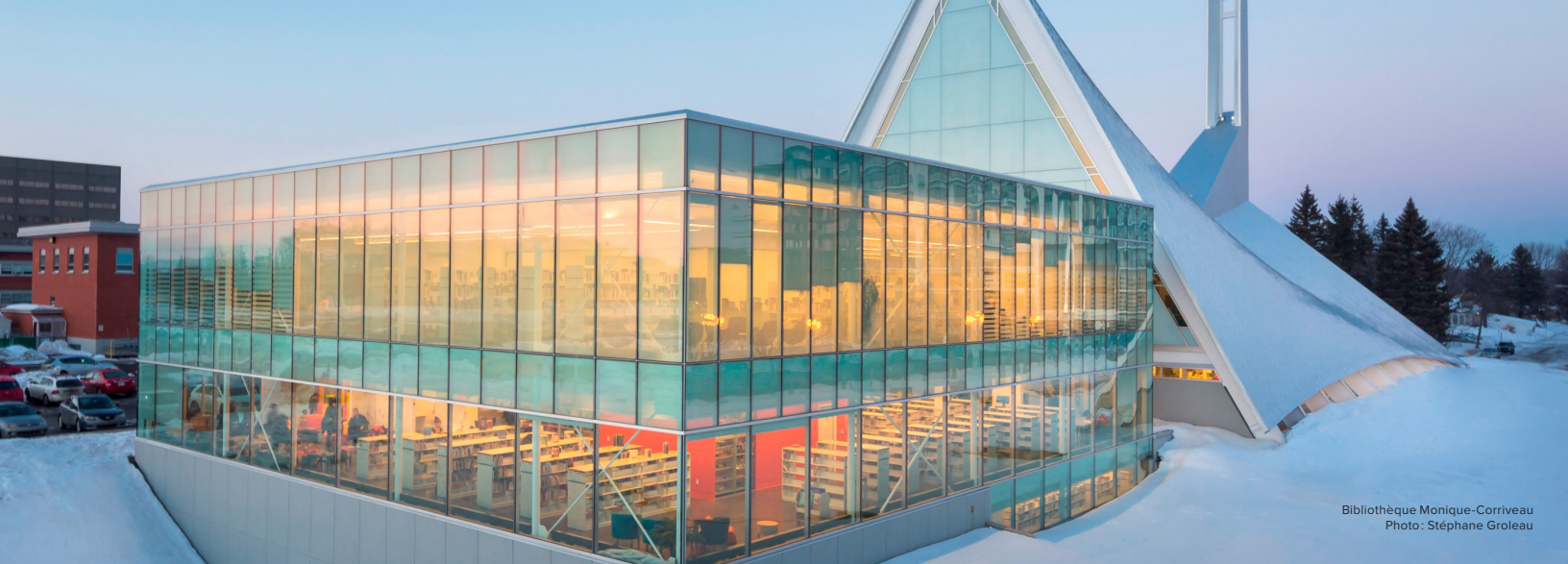
Bibliothèque Monique-Corriveau