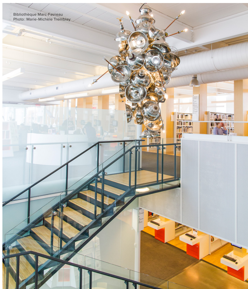
Bibliothèque Marc-Favreau