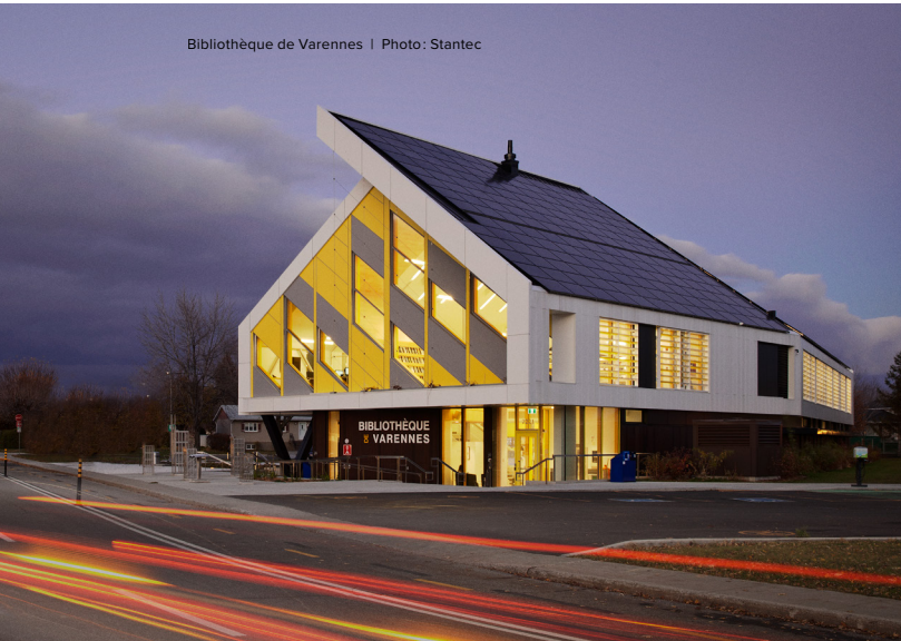
Bibliothèque de Varennes

La bibliothèque offre sans discrimination des services diversifiés pour répondre aux besoins de la population en matière d' information , de culture , d' éducation et de littérature .