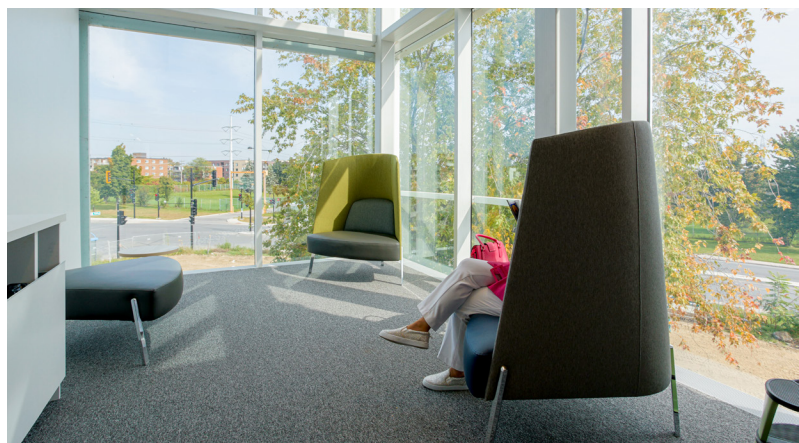
Bibliothèque L'Octogone