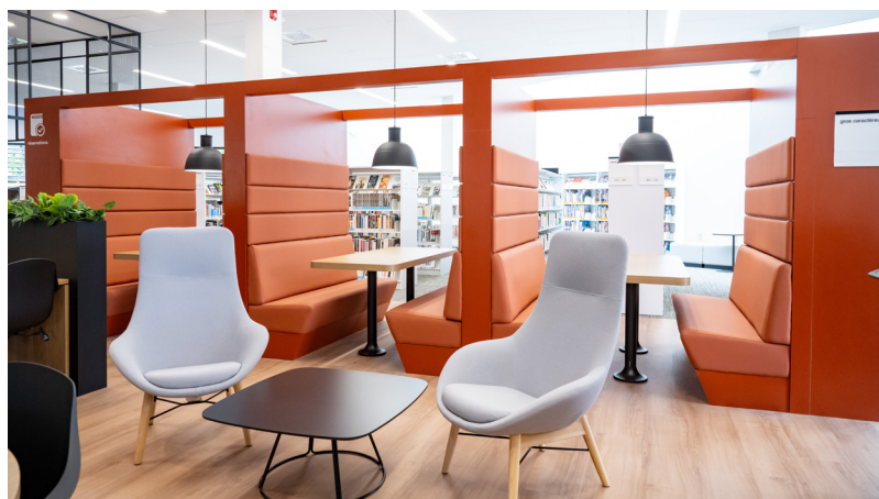
Bibliothèque Marie-Claire-Blais